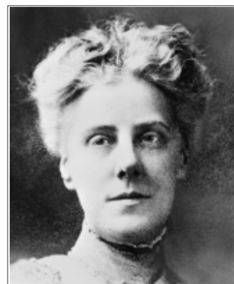
Ann Jarvis gilt als Begründerin des heutigen Muttertages. Da sie verärgert über die Geschäftemacherei war, bei der die eigentliche Botschaft verloren ging, wollte sie den Muttertag später wieder verbieten lassen.

Das Klischee der in der Küche stehenden Hausfrau, die nur für ihre Familie da ist, ist heutzutage längst überholt. Deshalb finden viele einen speziellen Tag, der Mütter einmal im Jahr für einen aufopferungsvollen und selbstlosen Einsatz "belohnen" soll, unpassend. Viele Mütter gehen arbeiten, und der Trend, dass auch Väter einen Teil der Hausarbeit und Erziehung übernehmen, setzt sich immer mehr durch. So fordern die meisten Frauen, dass das überholte Rollenbild irgendwann völlig der Vergangenheit angehören soll und das Aufziehen der Kinder sowie die Arbeit im Haushalt nicht länger "Frauensache" ist, sondern beide Elternteile gleichermaßen etwas angeht.