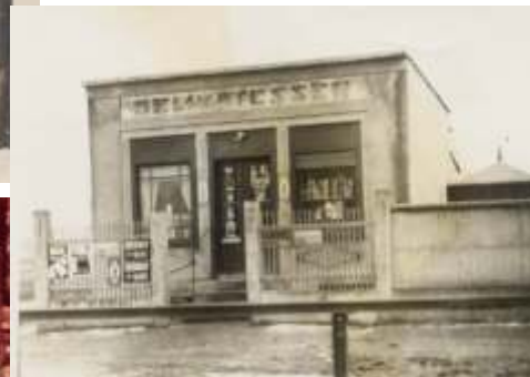
Kiosk „Am Bahnhof“